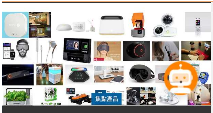
【科技百匯 一應俱全】

你 拇機抖 的科技大賞，無論是 優惠速遞 ，還是 新品快訊 ，透過資訊月online！頻道展前強打；設計線上展覽與現場活動串聯，讓消費者一次滿足、盡情享受！