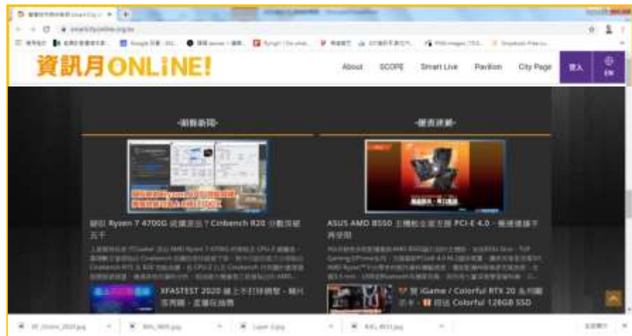
【新品快訊 優惠速遞】